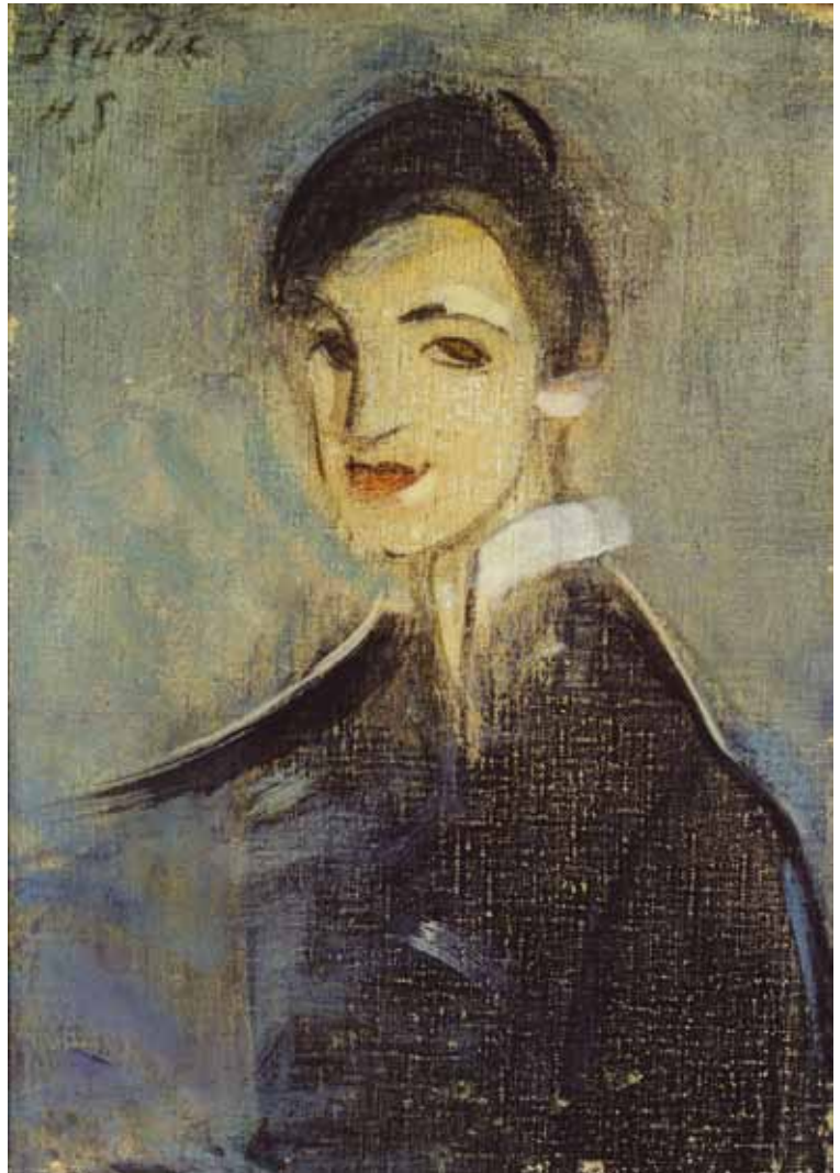
Helene Schjerfbeck: Laulajatar, musta 1916-17.