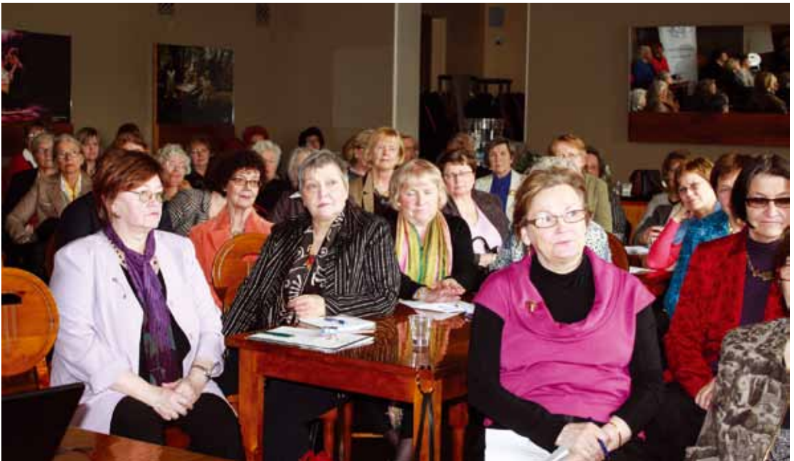
Kansallisteatterin kauniisti entisöity ylälämpiö täyttyi huhtikuuisena lauuantaina seinään myöten naisista.