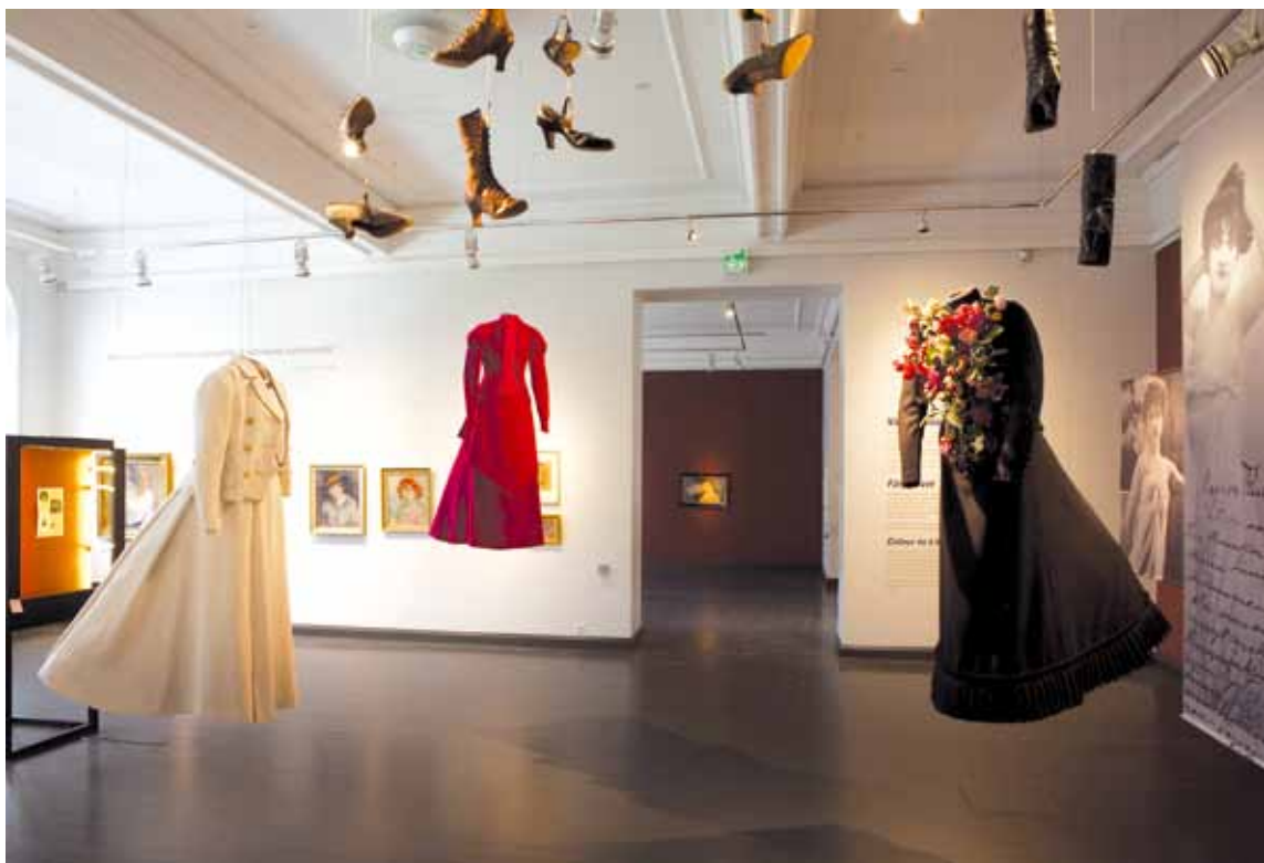
Näkymä Ateneumin näyttelystä Onerva – Kaupungin naiset.

L. Onerva oli monella tapaa kiinnostava henkilö. Hän eli nuoren aikuisiän Venäjän vallan aikaisessa Helsingissä, aikana jolloin kansallisuusaate ja suomalaisen kulttuurin kansainväliset kontaktit olivat ajankohtaisia. Suomen itsenäistyttyä Onerva oli 35-vuotias runoilija, kirjailija, kriitikko ja kääntäjä. Hän oli naimisissa säveltäjä Leevi Madetojan kanssa ja hänellä oli suhde Eino Leinon. Onerva oli sivistynyt ja itsenäinen kaupunkilainen nainen, joka uskoi naisen omaan vapaaseen tahtoon.