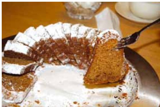
Minna Canthin kakku. Ohje sivulla 37.

Uusi näkökulma herätti vilkkaan keskustelun, mutta myös kahvihimon päiväsankarin tavoin; olihan Minna Canth valmis luopumaan melkein mistä muusta tahansa kuin kahvista. Sen seuralaisena tarjottiin naisliittolaisille kirjailijan nimikkokakkua, jonka ohje on peräisin Canthin perheen reseptikansiosista. ■