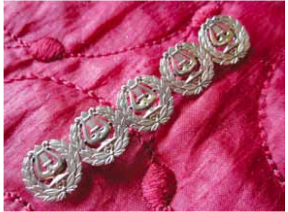
Lyyrakoru on siirtynyt perintönä äidiltä tyttärelle jo kolmessa sukupolvessa.

Oma äitini jäi leskeksi 45-vuotiaana isäni kuoltua vakavaan sairauteen. Itse olin tuolloin 15-vuotias. Perhe oli voimavara, joka varmaan auttoi äitiäkin. Sen lisäksi äiti osallistui aktiivisesti järjestöelämään. Ammattiyhdistystoiminta sairaanhoitaja- ja terveydenhoitajaliitossa poiki lukuisia muita kiinnostuksen kohteita. Kun Suomalaisen Naisliiton Oulun