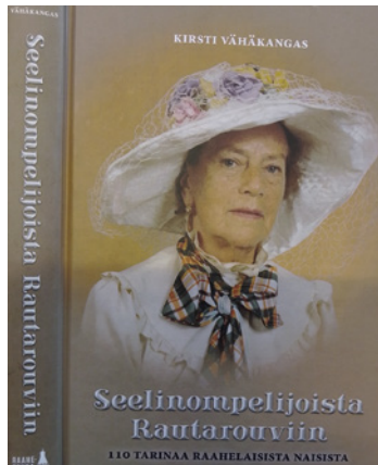
Seelinompelijoita ja rautarouvia -teos kertoo 110 raahelaisen naisen tarinat.

Kirjoittamisen hyvät opit Kirsti sai lukion äidinkielenopettajalta. Työpaikan kahvitaukopöydästä kysellyt ja saadut ohjeet ovat tuttuja monelle, niistä Kirsti Vähäkangaskin on kiitollinen. Päivätyö kaupungin palveluksessa on myös opettanut puolueetonta ja hillittyä kielenkäyttöä. Aiheita kanta-aottamiseen tosin olisi riittänyt paikkakunnalla, joka on ajan saatossa menettänyt