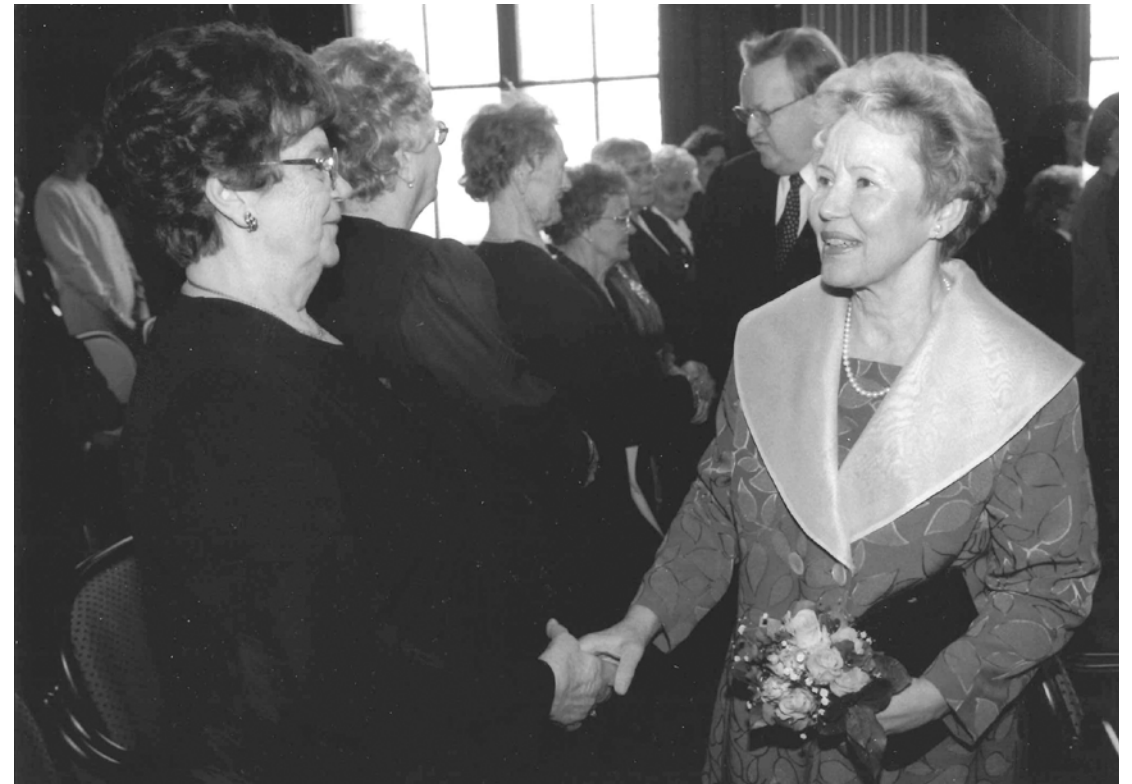
Eeva Ahtisaari ja presidentti Ahtisaari äitienpäiväjuhlassa 1998.

Presidentin puolisona Eeva Ahtisaari osasi hyödyntää kaikkea kokemaansa. Vaalikiertueella hän muisti Hilda Käikosken kokemaa matkustamisen iloa ja hankaluutta. Diplomaattielämän