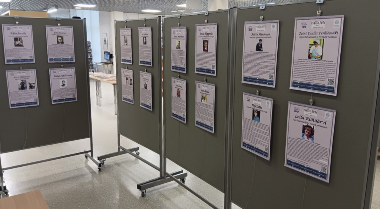
Osa Naisten Ääni -näyttelystä Raahen kirjastossa heinäkuussa 2024.