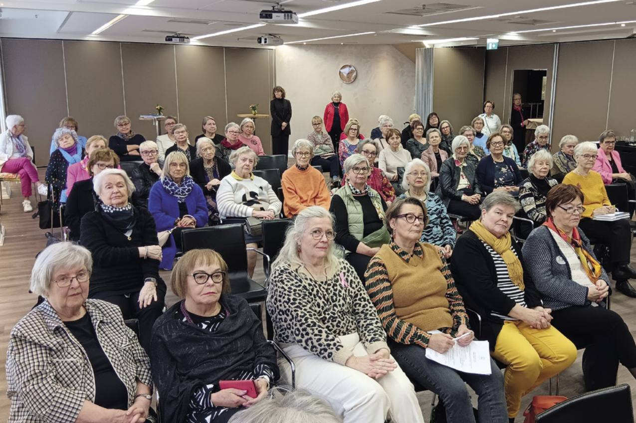
Seminaarin puheenvuoroja kuunneltiin keskittyneesti. Aiheista virisi puheiden loppuksi myös keskustelua.

Minna Canthin syntymästä 180 vuotta – Jyväskylässä antoisa juhlaseminaari