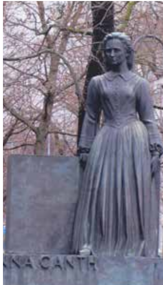
Nuoren Minna Canthin patsas Tampereella.

Vuonna 1889 Minna Canth perusti Wapaita aatteita -lehden, koska halusi julkaista uutta maailmankuvaa käsitteleviä artikkeleita. Lehdessä oli myös käännöksiä ja realistisia novel-