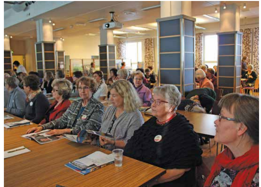
Lasaretin Yrjö-Sali täyttyi lokakuun ensimmäisenä lauantaina verkostoituvista naisista.