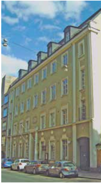
Tieteiden talo Helsingin Kruununhaassa Kirkkokadulla.