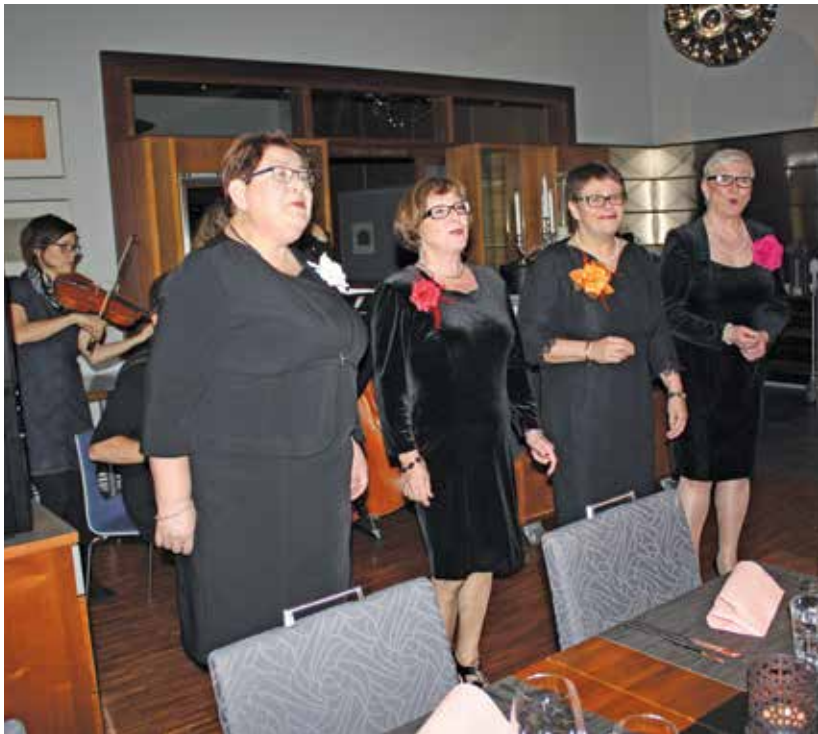
Illanvieton kruunasi Puistolan tädit, joiden laulut aktivoivat osallistujien tanssijalat.

Aleksandra Gripenberg oli toimelia luennoitsija, kirjoittaja, joka liikkui hyvin kansainvälisesti. Hän muun muassa organisoi ICW:n kansallisten järjestöjen perustamisen Euroopan maihin. Kielitaitoisena hän osallistui Suomen Naisyhdistyksen edustajana useisiin naisten kansainvälisiin kokouksiin, muun muassa Washingtonissa 1888 ja Berliinissä 1904.