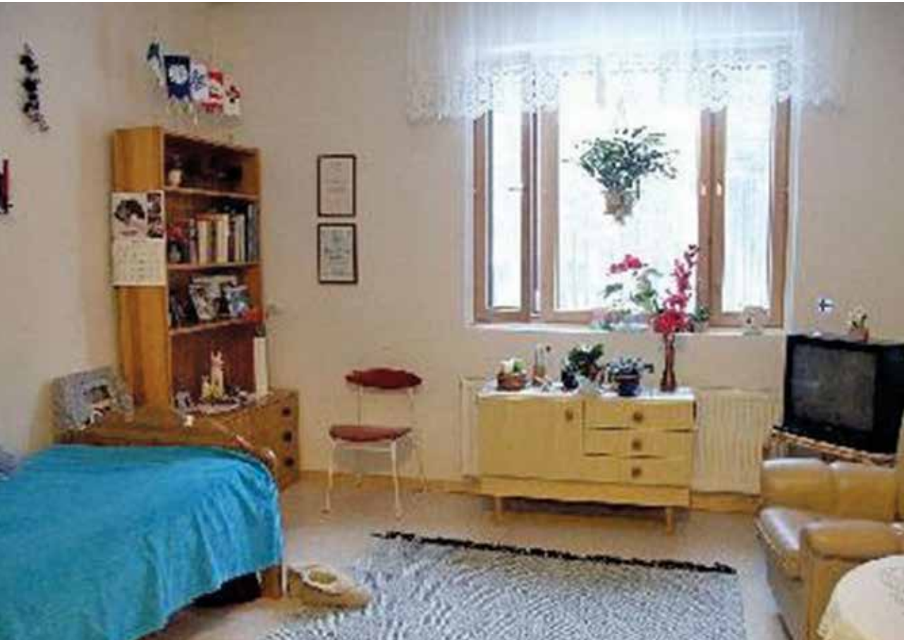
Kukkasrahaston palvelukoti on nimensä mukaisesti viihtyisä ja hyvin hoidettu koti.