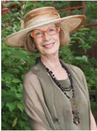
Kirjailija Kaari Utrio on Naisen Ääni -verkkojulkaisun suojelija.

– Kun diktatuuri käy riittävän ahdistavaksi, kansa nousee sitä vastaan. Koska kansannousu ei ole kuitenkaan järjestäytyneet eikä sillä ole selviä johtajia, edessä on sekasorto. Se taas antaa jälleen tilaa diktatuurille, Kaari Utrio pelkistää. Todis-