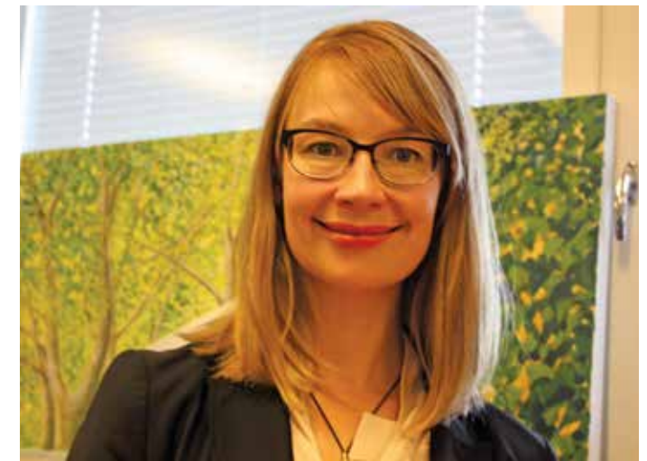
Tytti Tuppurainen kertoo olevansa naisasianainen ja pyrkivänsä työssään parantamaan naisten asemaa

Kun FM Tytti Tuppurainen , oululainen naisasianainen ja poliitikko, 2000-luvun alussa valittiin Oulun demareiden naistiimin puheenjohtajaksi, edellinen puheenjohtaja Liisa Jaakonsaari kannusti häntä: