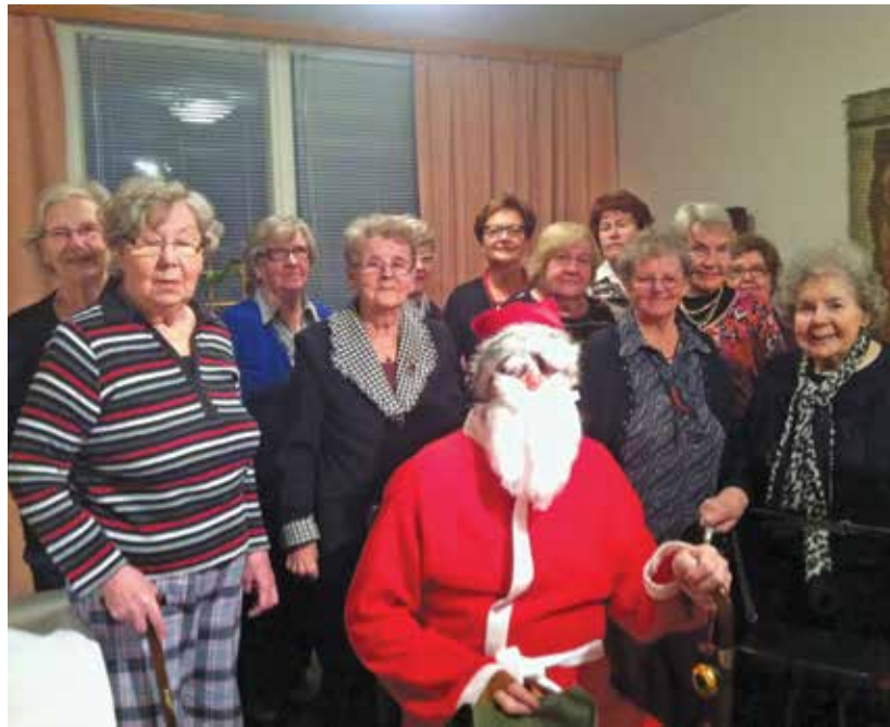
Ystäväpiiriläisten pikkujoulujuhlaa vietettiin vuosi sitten.

Naisklubin jäsenissä ei ole kovinkaan monta varsinaisen vanhustyön ammattilaista, mutta intoa sitäkin enemmän.