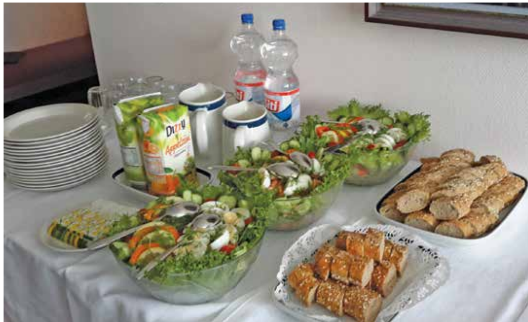
Ikääntyvien ruokavalio maistiaisten kera oli yhden ystäväpiirin illan teemana, jonka toteuttivat Vaasan opiston lähihoitajaopiskelijat.