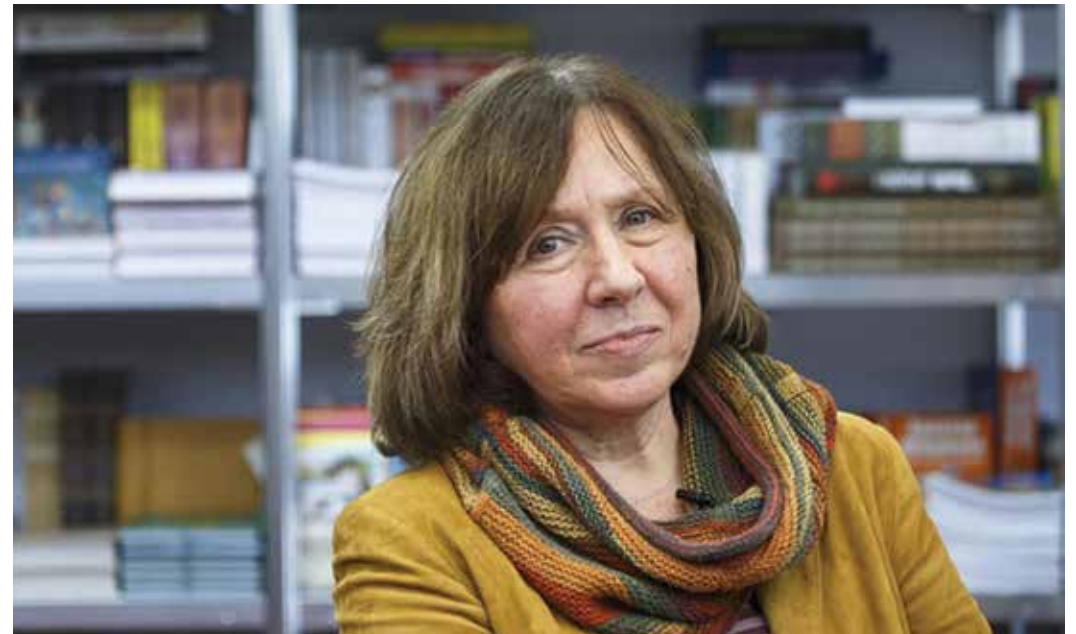
Nobelin kirjallisuuspalkinnon 2015 saaja Svetlana Aleksijevitš.

muodolla. Aiheensa hän oli ottanut kuhunkin teokseensa kotimaansa suurista yhteiskunnallisista traumoista: toisesta maailmansodasta, Afganistanin sodasta, Tšernobylista ja myöhemmin Neuvostoliiton romahtamisesta ja sen jälkeisestä demokratian etsikkoajasta, tuhlatasta ja menetetyistä ajasta. Hän oli haastatellut satoja ihmisiä, jotka kertoivat miten nuo traumat olivat suistaneet heidän elämänsä raiteiltaan. Teokset ovat yhtä aikaa dokumentaarisia ja kaunokirjallisia.