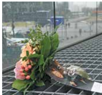
Nimilaatan vielä puuttuessa kukkavikhoon kiinnitettiin Teklan kuva.

Tiistaina kahdeksantena huhtikuuta Helsingin kaupunkisuunnittelulautakunta teki päätöksen, jota Suomalaisessa Naisliitossa oli pari vuosikymmentä odotettu. Tekla Hultin, aikansa merkittävä yhteiskunnallinen vaikuttaja ja Naisliiton ensimmäinen puheenjohtaja, sai nimikkoaukion Helsingin sydämessä, osan Sanomatalon vieressä olevasta Mannerheimin-aukiosta.