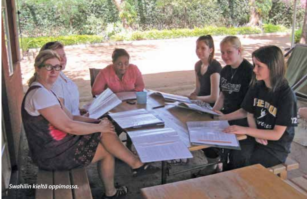
Swahilin kieltä oppimassa.

TEKSTI: SOILIKKI SUORANTA