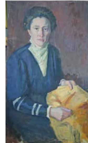
Tekla Hultinin maalaama omakuva.

– Tekla Hultin oli rohkea, nykyaikainen ja ainokainen. Hänellä on ollut suuri rooli yhteiskuntamme kehityksessä. •