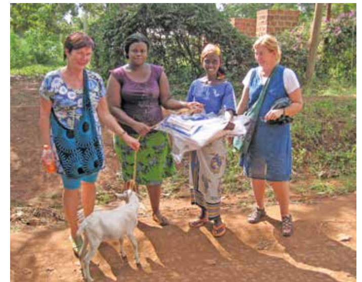
Kylästä ostettiin vuohia, jotka lahjoitettiin paikallisille naisille.

Ehtivät Vaasan tytöt lopuksi pidennetylle viikonlopulle Sansibariinkin.