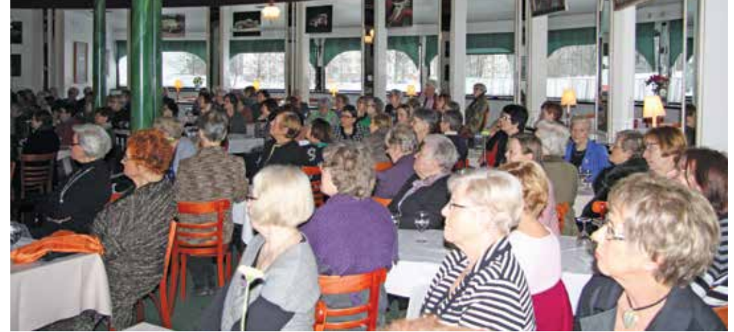
Kaisaniemen seminaariin osallistui 120 kirjoista ja kirjoittamisesta kiinnostunutta.