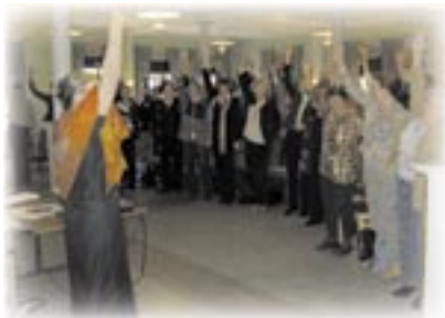
Minna Canth -seminaarin antia mm. sivuilla 4–10.