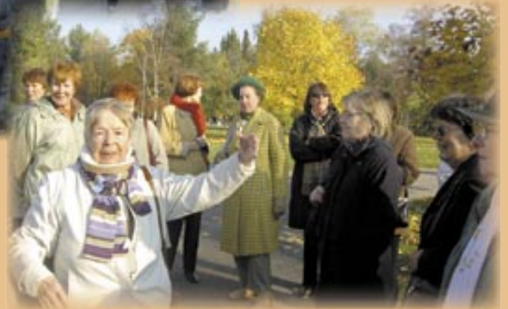
Minna Canth -seminaari ja Suomalaisen Naisliiton syyskokous 2005 päättyi happihyppelyyn aurinkoisessa Oulussa.