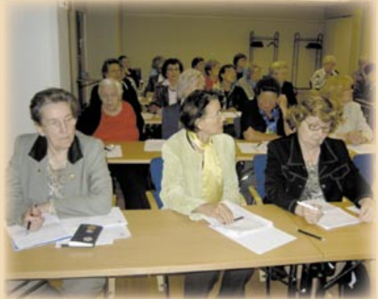
Suomalaisen Naisliiton syyskokouksessa Oulun SAS -hotellissa 9.10.2005.