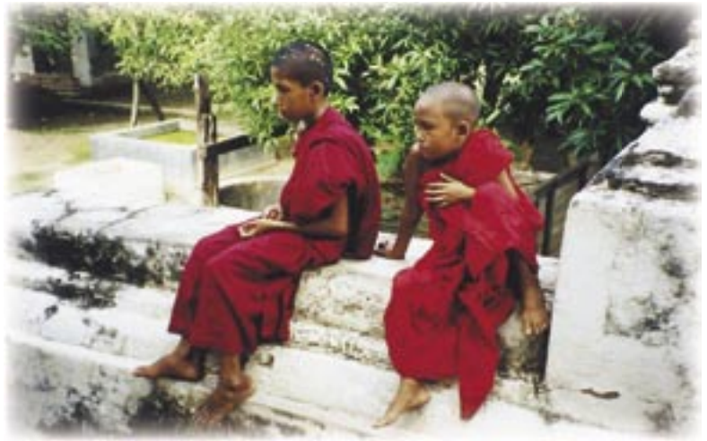
Pienet luostarikoululaiset punaisissa kaftaneissaan luostarialueella.

oli viettänyt vuosia vankiloissa mielipiteittensä vuoksi. Nyt he saivat esiintyä, mutta heitä tarkkailtiin koko ajan, erityisesti sen vuoksi, että he olivat Aung Sanin henkilökohtaisia ystäviä. He esittivät meille lyhyitä sketsejä, joita selvennettiin englanninkielisillä tauluilla. Ymmärtäminen oli välillä vaikeaa, ne liittyivät varovaisesti ajankohtaisiin ongelmiin satiirin ja huumorin kautta.