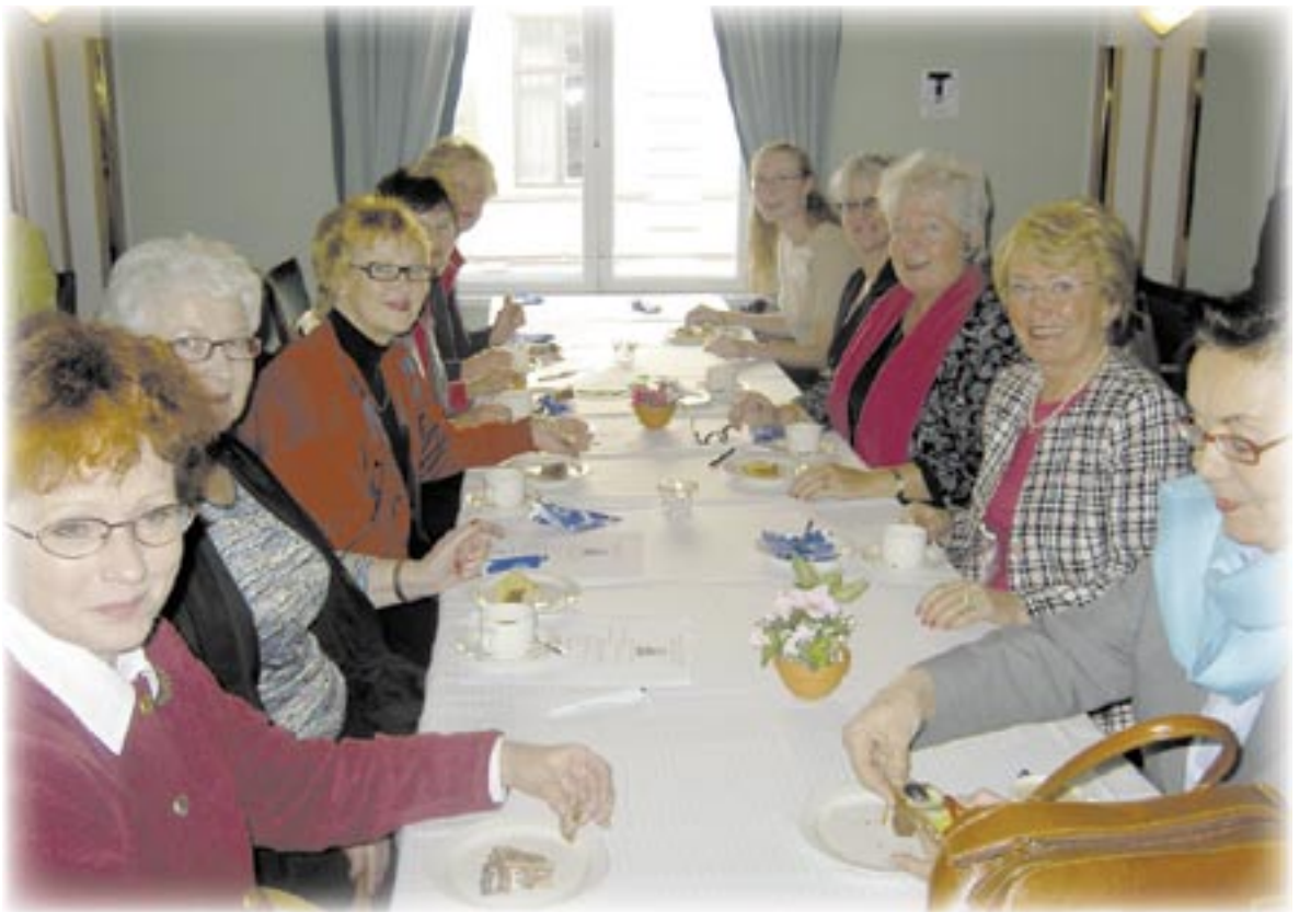
Naisliiton toiminnan kulmakiviä on naisten kouluttaminen ja jatkuva kehittäminen. Tässä iloinen joukko kahvituolla Oulun lokakuuisessa seminaarissa.

Suomalainen Naisliitto ry on jäsenenä Naisjärjestöjen Keskusliitossa, Suomen Unifem ry:ssä ja Suomen Kukkasrahastossa. Kaikissa järjestöissä pyritään edistämään tasa-arvoa ja tuomaan esiin naisnäkemystä.