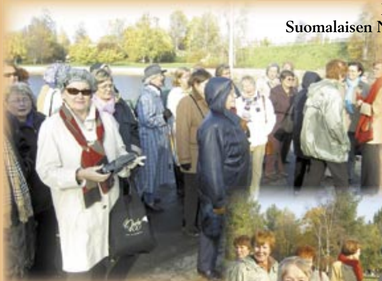
Oulu näytti Naisliiton ulkoiljoille aurinkoiset kasvat.