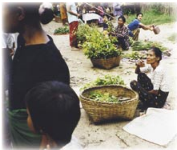
Nainen ja korillinen myytävää. Bagan torielämää.

Ajettiin kauan pitkin valottomia katuja, päädyttiin pimeälle alueelle, jossa yhden talon ovi- aukosta näkyi valoa. Siellä oli Moustache Brothers-ryhmän teatteri. Pitkä seinä oli täynnä marionetti- ym. nukkeja. Niiden kautta ja avulla ryhmä oli 30 vuoden ajan kiertänyt maaseudulla kertomassa ihmisten oikeuksista, vääryyksien vastustamisesta. Jokainen heistä