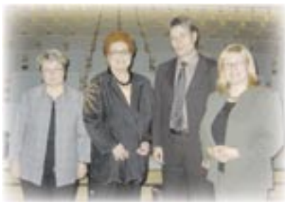
Uusi hanke käynnistyi Torniossa. Sivu 26.

Sivu 3. Puheenjohtajalta. Naisen oma kuva ja itsetunto.