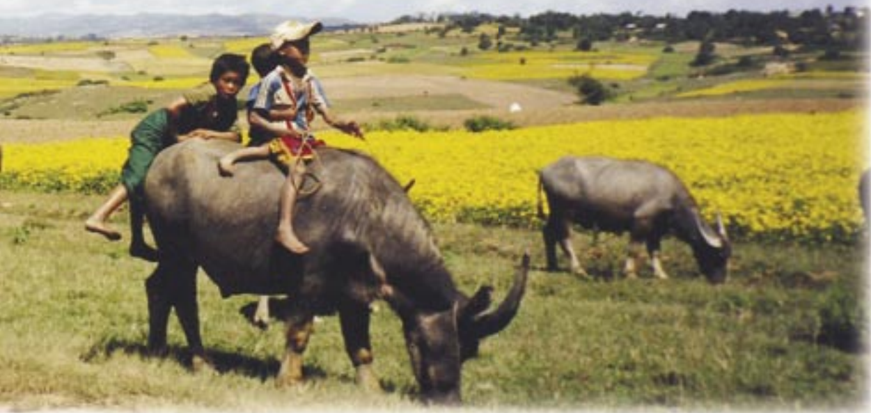
Lumoavan kaunista maaseutua matkalla Inle-järvellä. Pienet maalaispojat leikkivät härkien päällä.

Pääkaupungissa Yangoonis- sa, entinen Rangoon, (asukkaita 2,5 milj.) tutustuimme kauniisiin isoihin pagoda-alueisiin mm .Schwedagoniin, joka on Kaak- kois-Asian temppeleistä pyhin, koska se on ainoa pyhäkkö, jossa on aitoja Buddhan jään- nöksiä mm. kahdeksan hiusta. Joka puolella kultaa, kimallusta, rukoilevia ihmisiä buddhapat- saiden edessä. Katujen varsilla myytiin monenlaisia meille vieraita ruokia: savustettuja heinäsirkkoja, taikinanyyttejä, lootuksen hedelmiä, paistettuja julman näköisiä kaloja, beteliä. Kerjäläisiä ei näkynyt, eivät kai uskaltaneet kerjätä, mutta myös- kään ei näkynyt sotilaita eikä po- liiseja, mutta ihmisiä pursuavia linja-autoja kylläkin.