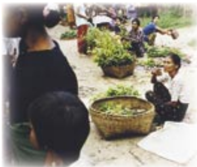
Naisen arkea, mutta missä? Sivu 16.