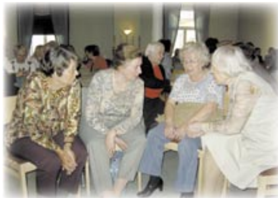
Kuvasikermä Mikä meitä voimaannuttaisi. Sivut 14–15.